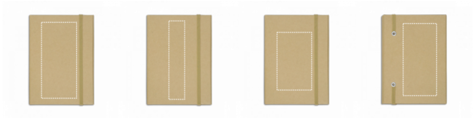
SÍTOTISK (PLAST, PAPIR) Zápisník | Střed 60 x 130 mm