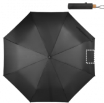
SÍTOTISK (TEXTIL) Deštník | Panel 4 200 x 120 mm