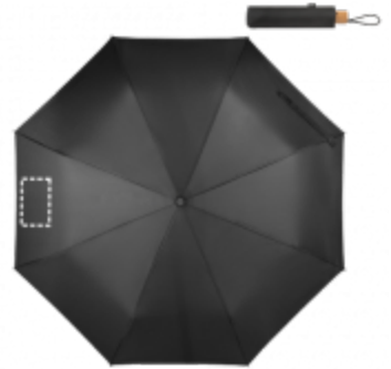
SÍTOTISK (TEXTIL) Deštník | Panel 1 200 x 120 mm