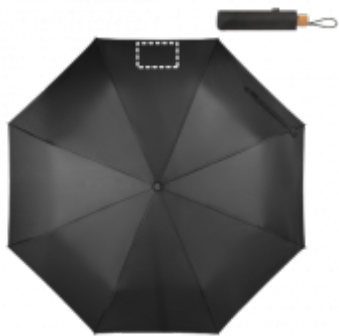
SÍTOTISK (TEXTIL) Deštník | Panel 3 200 x 120 mm