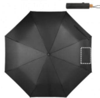
TRANSFER Deštník | Panel 4 200 x 120 mm