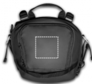
DIGITÁLNÍ TRANSFER Batoh | Kapsa 100 x 95 mm