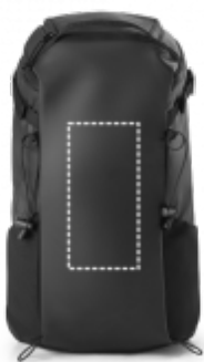
DIGITÁLNÍ TRANSFER Batoh | Střed 120 x 250 mm