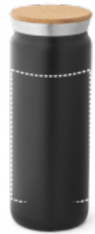
SÍTOTISK (PLAST, PAPÍR) Termoláhev | Hrnek 130 x 120 mm