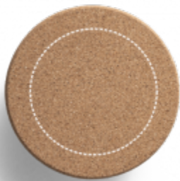
GRAVÍROVÁNÍ LASEREM Termoláhev | uzávěr láhve Å ~ 55 mm