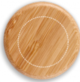
TAMPONTISK Sportovní láhve | uzávěr láhve ø 35 mm