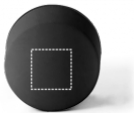
TAMPONTISK Termoláhev | uzávěr láhve 30 x 30 mm