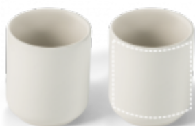
SÍTOTISK (PLAST, PAPIR) Šálek 2 | Cup 230 x 45 mm