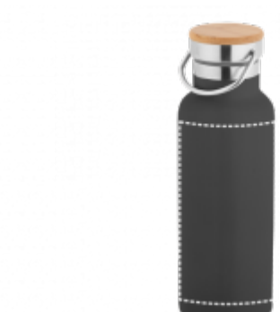
DIGITÁLNÍ UV (360) Termoláhev | Hrnek 226 x 130 mm