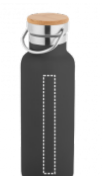
DIGITÁLNÍ UV TISK Termoláhev | Hrnek 15 x 130 mm