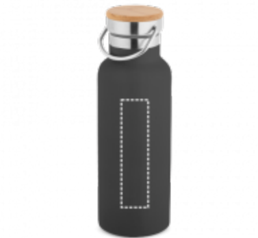
GRAVÍROVÁNÍ LASEREM Termoláhev | Hrnek 25 x 100 mm