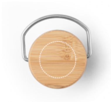
TAMPONTISK Termoláhev | uzávěr láhve ø 40 mm