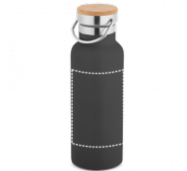
SÍTOTISK (PLAST, PAPIR) Termoláhev | Hrnek 140 x 100 mm