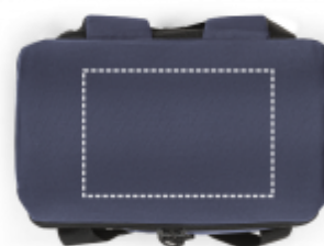
DIGITÁLNÍ TRANSFER Taška | Flap 150 x 100 mm