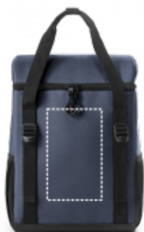
DIGITÁLNÍ TRANSFER Taška | Střed 120 x 200 mm