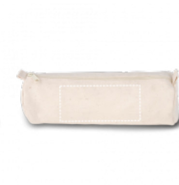
DIGITÁLNÍ TRANSFER Pouzdro | Zadní část 130 x 60 mm