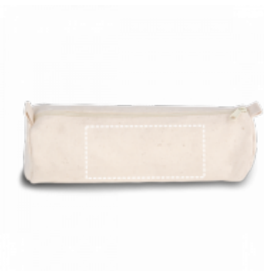
DIGITÁLNÍ TRANSFER Pouzdro | Střed 130 x 60 mm