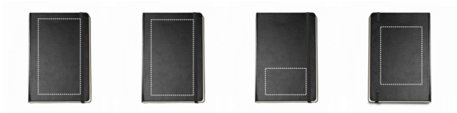
SÍTOTISK (PLAST, PAPÍR) Zápisník | Střed 100 x 180 mm