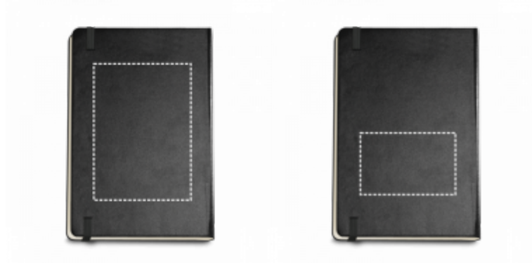
DIGITÁLNÍ UV TISK Zápisník | Zadní část 100 x 140 mm